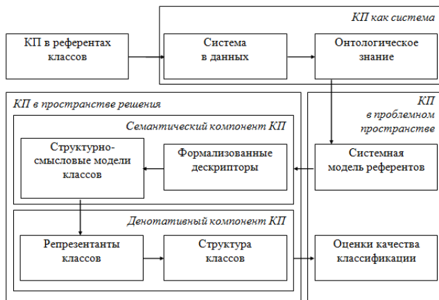
Рис. 2 — Формы представления КП

Метод проникает в онтологическую проблему предметной области каждой классификационной задачи. Он воспринимает исходно заданный состав классов и их обусловленность исключительно как условие предметно-содержательного исследования, нацеленного на познание, понимание и рациональное объяснение научно-достоверных онтологических оснований, выражающих основные закономерности и существенные свойства классифицируемых объектов. Решение классификационной задачи раскрывает смысловое содержание классов и устройство денотата КП, дает каждому классу КП научное подтверждение или обоснованное опровержение. В первом случае решение гарантирует успешную идентификацию классов, во втором случае – служит основанием для улучшения обусловленности классов, дает полезные ориентиры для когнитивной и аналитической работы в этом направлении.