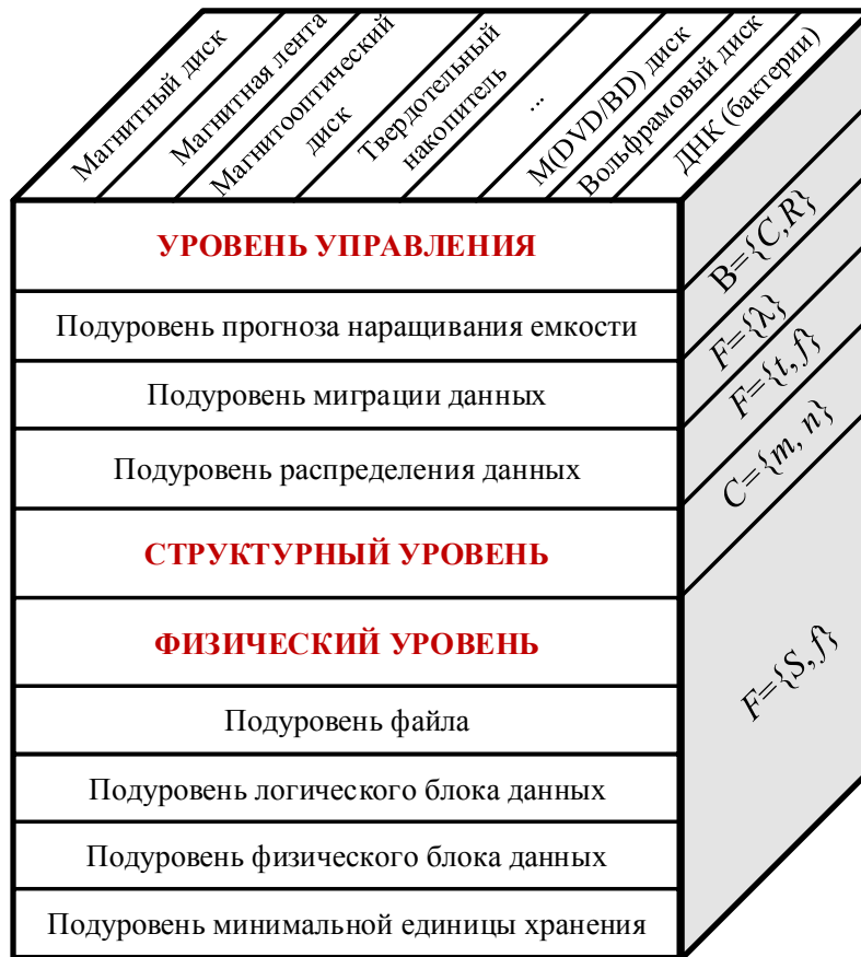
Рисунок 1 – Многоуровневая модель хранения данных

Физический уровень состоит из четырех подуровней, соответствующих инкапсуляции данных: Минимальная единица хранения → Физический блок данных → Логический блок данных → Файл. Соответственно, на подуровне МЕХ реализуются функции по поддержанию устойчивого состояния минимальной единицы хранения, на подуровне физического блока происходит инкапсуляция МЕХ в физические блоки данных, далее на подуровне логического блока данных происходит инкапсуляция физических блоков данных в логические. На подуровне файла определяется адресация битов данных, физических и логических блоков и происходит логическое объединение битов данных в файл.